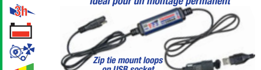
Zip tie mount loops on USB socket